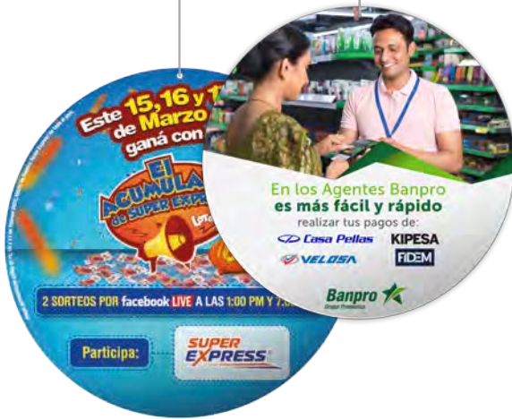
Colgantes vinil / flauta