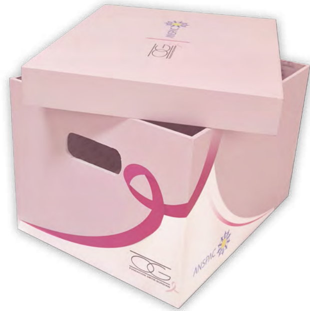
Estructuras en vinil sobre pvc